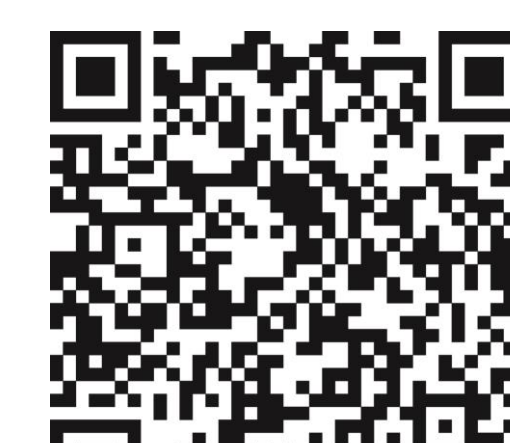
Weitere Informationen BZgA

Hotlines zum neuen Coronavirus Bundesministerium für Gesundheit: 030 346 465 100 Unabhängige Patientenberatung Deutschland: 0800 0117722 Patientenservice: 116 117