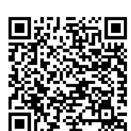
**Corona-Regelungen in den Bundesländern

Hotlines zum neuen Coronavirus Bundesministerium für Gesundheit: 030 346 465 100 Unabhängige Patientenberatung Deutschland: 0800 0117722 Patientenservice: 116 117